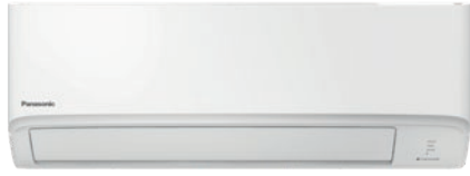
Sisäyksikön leveys vain 765 mm